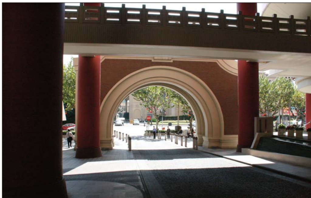
Колите излизат през сводестата арка на хотел „Риц – Карлтън“ сякаш от леговището на Тигъра