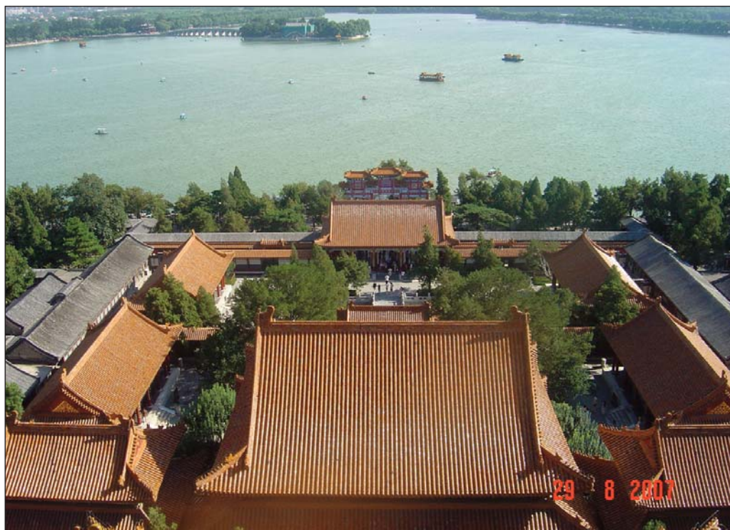
Каскадното разположение на главните постройки в Летния дворец им осигурява защита на Костенурката отзад, второстепенните павилиони отстрани по склона са Тигър и Дракон, Фениксьт е пред всяка постройка, а за всички заедно той е зад езерото