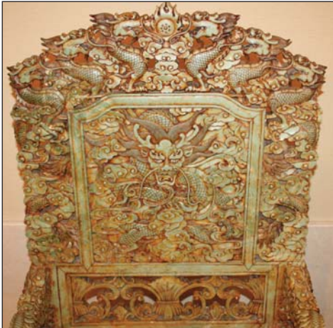
Драконите, инкрустирани в облегалката на нефритен стол, осигуряват защита на всеки, който седи на него