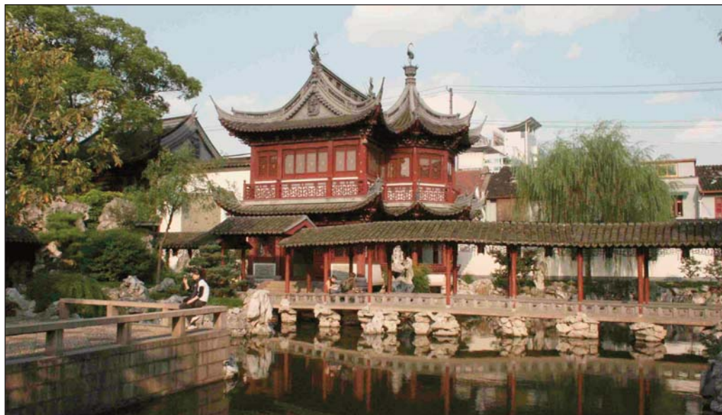
Хармония и плавно протичане на положителната енергия Ци по извитите алеи в 400-вековната градина „Ююен” в Шанхай