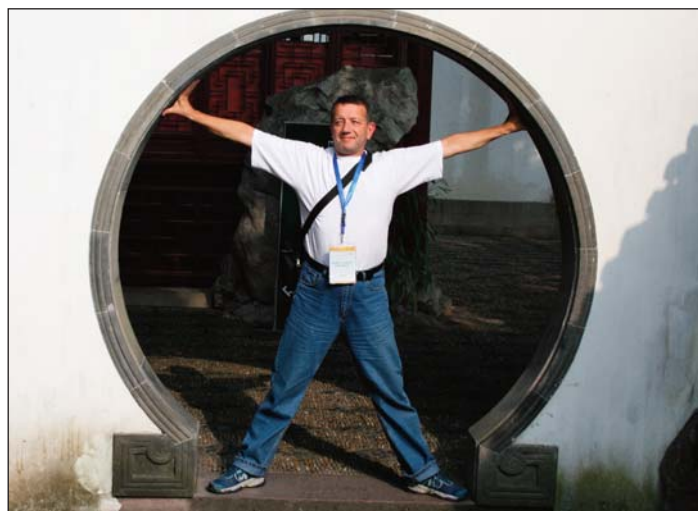
Кръгъл проход в стена, като дворна врата, с човешки размери в градината „Ююен“ в Шанхай