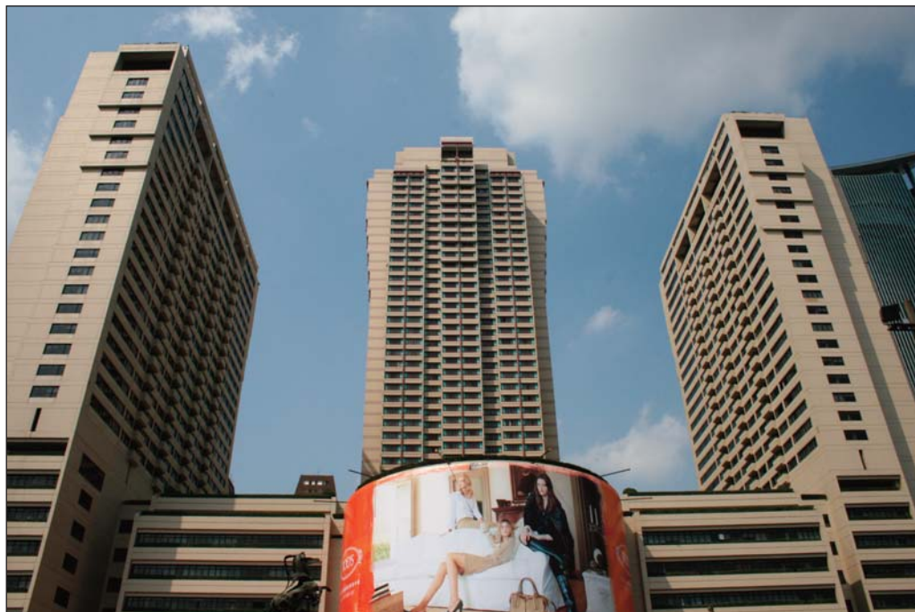
Хотел „Риц – Карлтън” в Шанхай – двете странични по-ниски тела са като Зеления дракон и Белия тигър