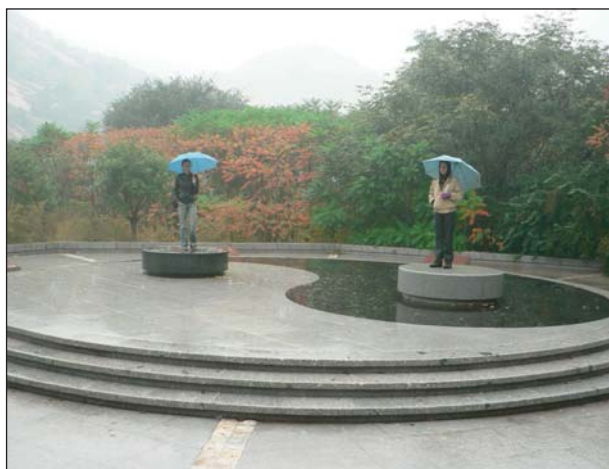
Знакът Ин-Ян, направен в парк в началото на Великата китайска стена