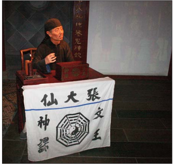
Фигура на Фън Шуй майстор, гадател и астролог пред будистки храм в Градския музей под телевизионната кула в Шанхай