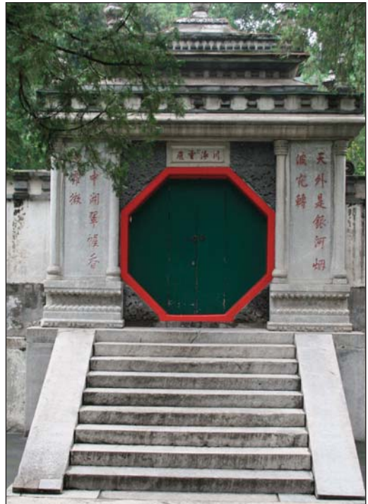
Вход на павилион в Летния дворец – Драконът и Тигърът са двете плътни части от страни на стълбата, а самата врата е с осмоъгълна форма – както са подредени и осемте триграми