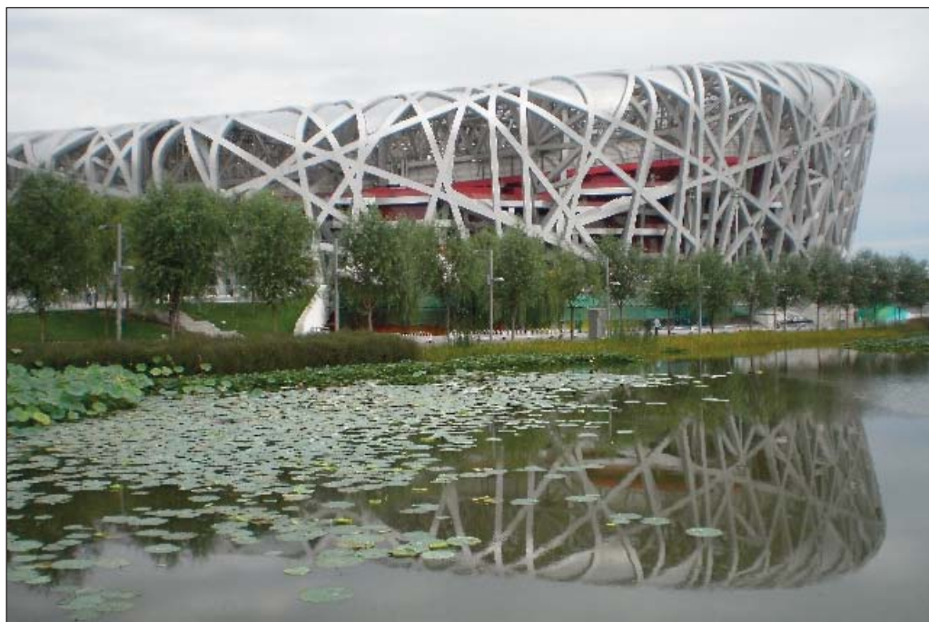
Най-известният спортен обект в Пекин – Олимпийският стадион „Птичето гнездо”