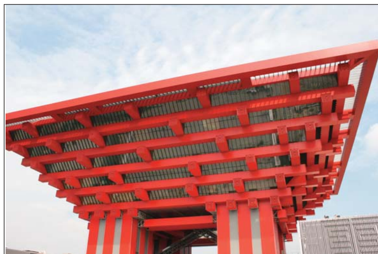
Китайският павилион за световното изложение ЕХРО 2010 в Шанхай