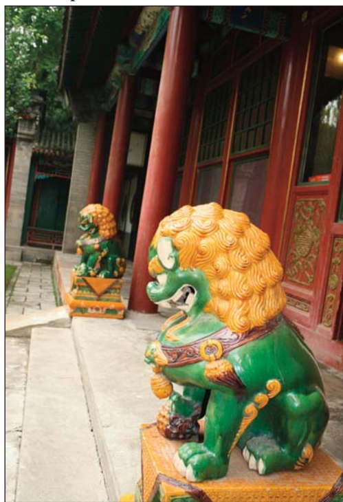
Цветни керамични кучета Фу пред павилион в Летния дворец в Пекин