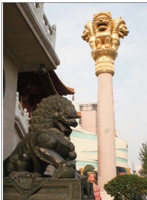
Бронзово мъжко куче Фу пред централния вход на будистки храм в Шанхай, на втори план е колоната с тройка позлатени индийски лъвове